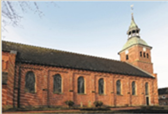
Ss. Cosmas und Damian