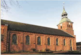
Ss. Cosmas und Damian